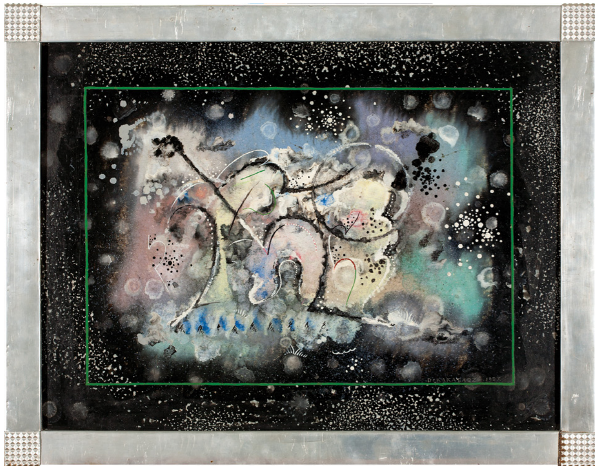
„ԲՅՈՒՆԱՅԻՆԻ ՑՄՈՒՅՈՒՄ“ 1927 ԲԵՅԱՐ, ՆԵՄԻ