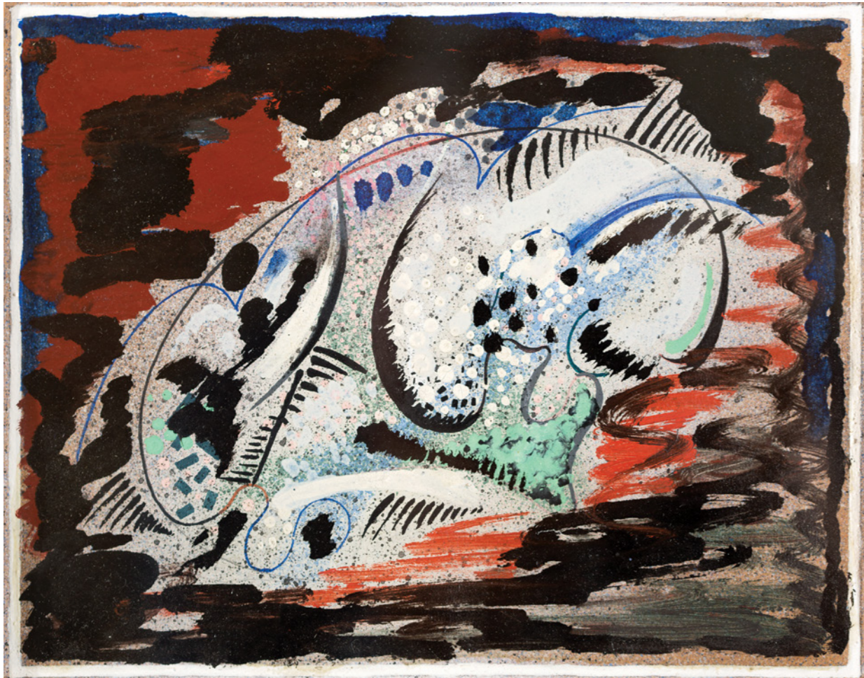
საჩილიანე "სივრცე, ხაზი ფერი" 1926 ქაღალდი, შერეული ტექნიკა

FROM THE SERIES "SPACE, LINE, COLOR" MIXED MEDIA ON PAPER, 22X31CM.