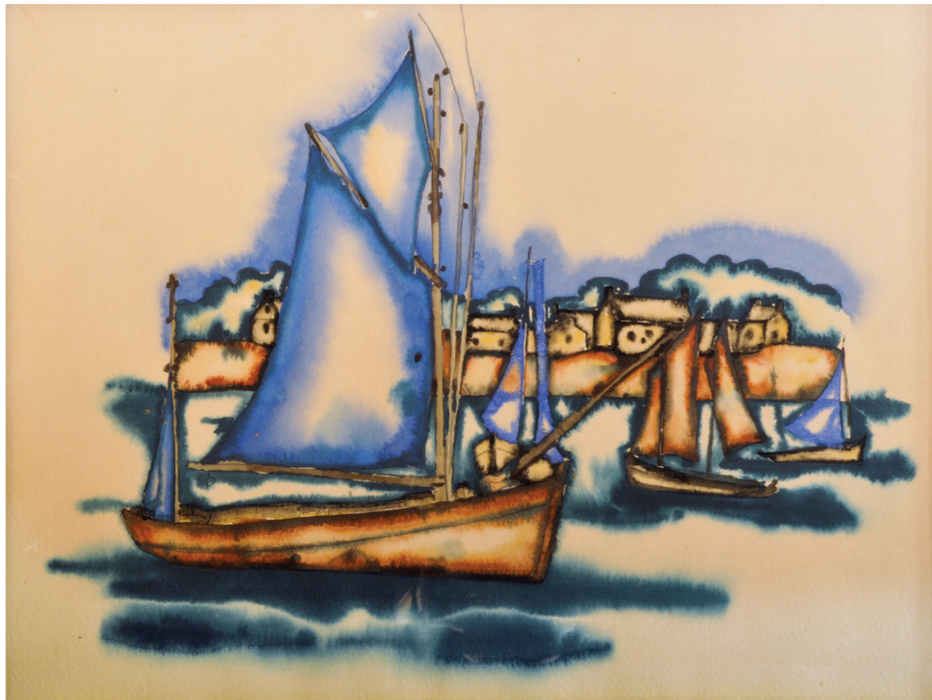
“ბრეტანი” 1921 ქაღალდი, აკვანატი “BRETAGNE” WATERCOLOR ON PAPER, 24X32CM.

პირადი კოლექცია; წარმონაჩვენს ბათი გალერეა PRIVATE COLLECTION; COURTESY BY BAIA GALLERY