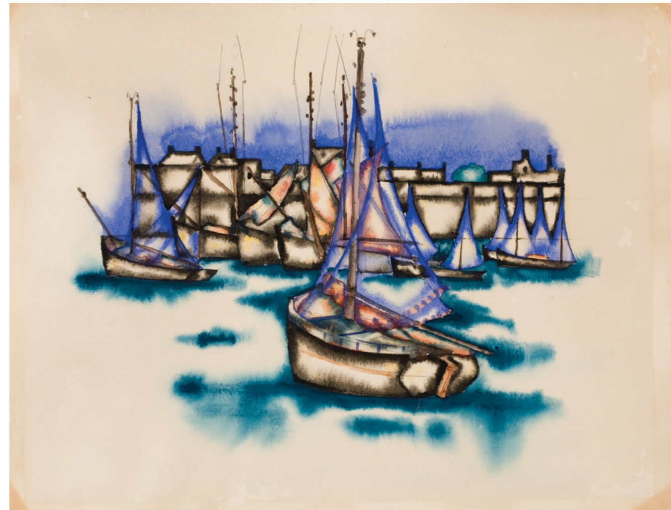
"ბრეტანი" 1921 ქაღალდი, აკვანატი

კანკო კოლექცია; წარმონაღებენ ბათი ბაღჩაია PRIVATE COLLECTION; COURTESY BY BAIA GALLERY