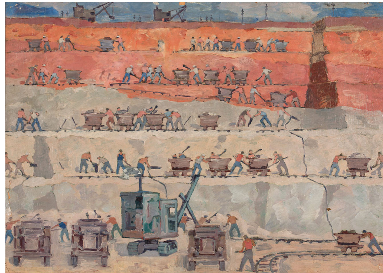
“გუმბრინის დამუშავება კუთაისის მიდამოებში” 1951 შალვა ამაგიში