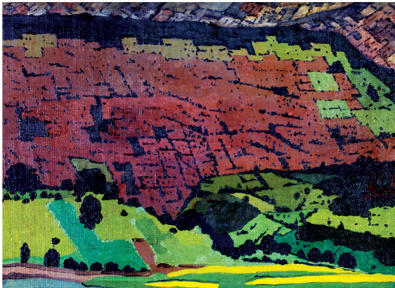
“იმერეთი” 1934 შალვა ამაგიში, ტილო, ნათი