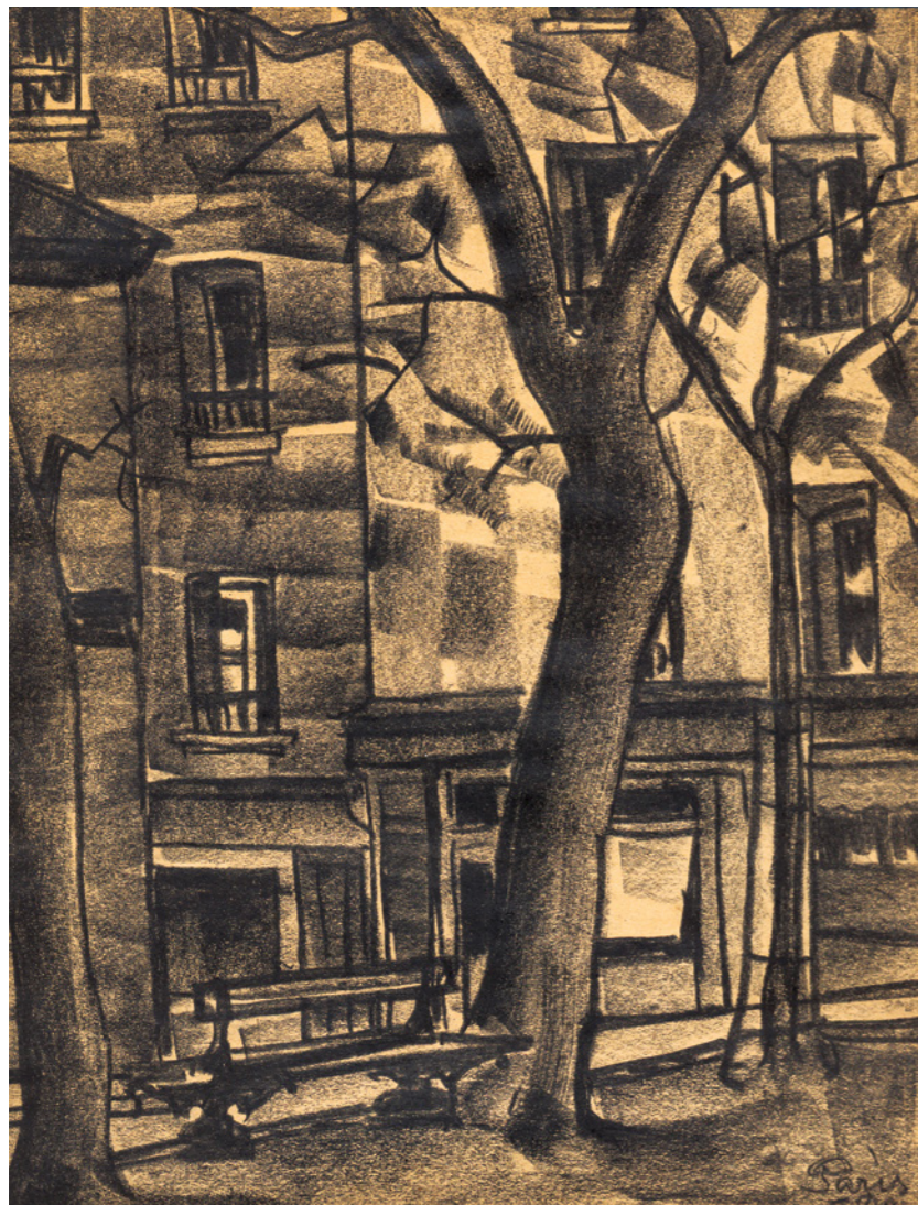
საჩიორან "პარიზი" 1920 პენსილი, სანემონა