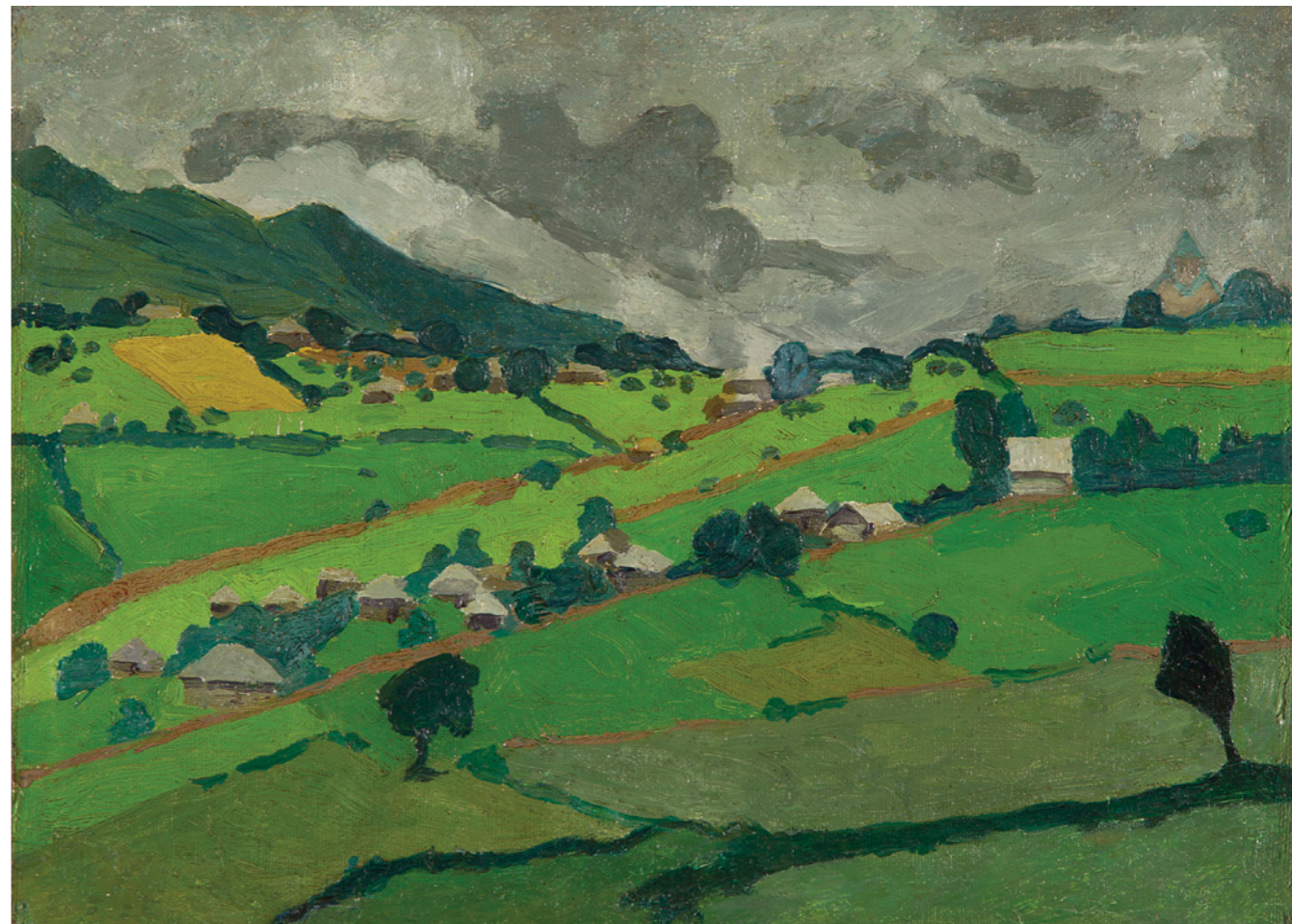
"იმერული პეიზაჟი" 1915 ტილო, ზეთი

პანკო კოლეჩიტი; წარმონაჩვენს ბაია გალერია PRIVATE COLLECTION; COURTESY BY BAIA GALLERY