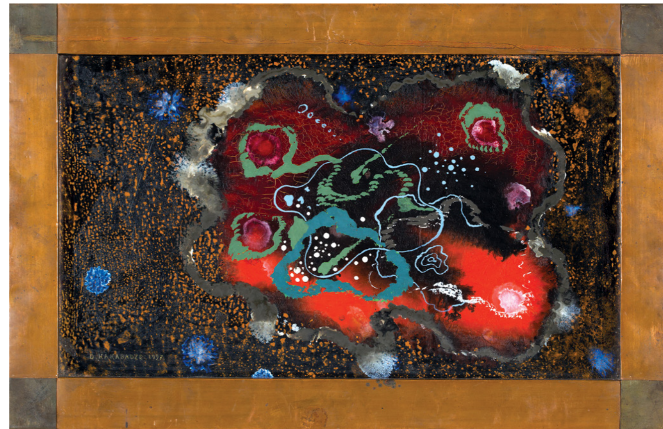
„ԲՅՈՒՆԱՅԻՆԻ ՑՄՈՒՅՈՒՄ“ 1927 ԲԵՅԱՐ, ՆԵՄԻ