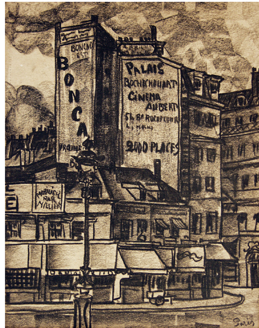
სერიის “პარიზი” 1920 ქაღალდი, სანგინა

პირადი კოლექცია; წარმონაჩვენს ბათი გალერეა PRIVATE COLLECTION; COURTESY BY BAIA GALLERY