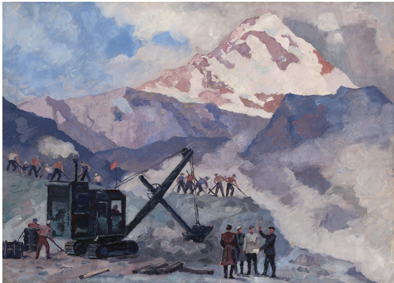
“ქვის სავაჭრო ყაზბეგში” 1949 ზინობიძე, ზეთი