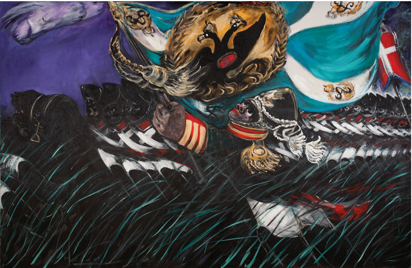
იერიში, ტილო, აკრილი. 315 X 250 Attack, Canvas Acrylic. 315 X 250