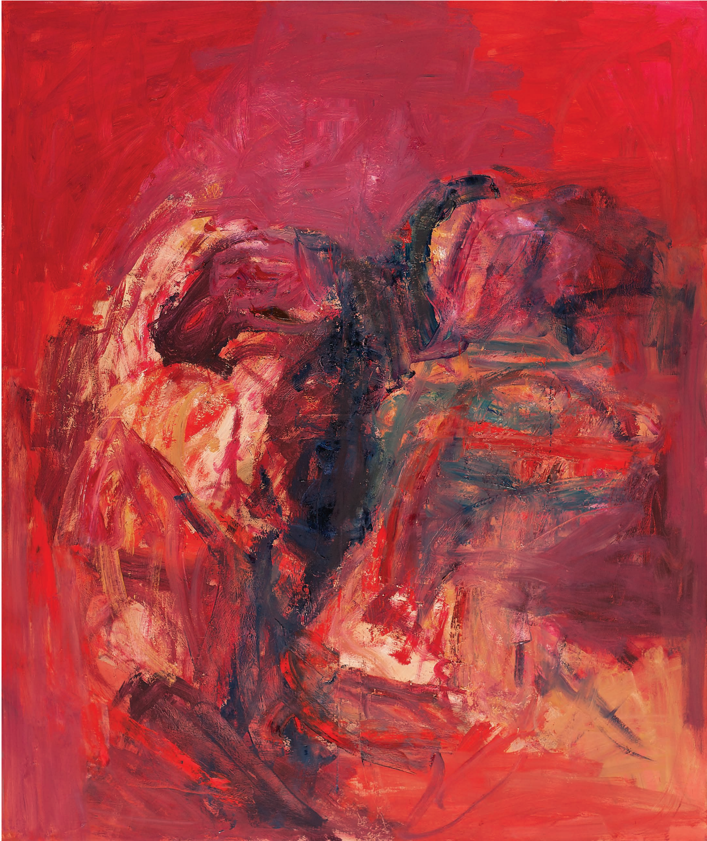
ტორსები, ტილო, ზეთი. 100 X 80 Torsos, Oil, Canvas. 100 X 80