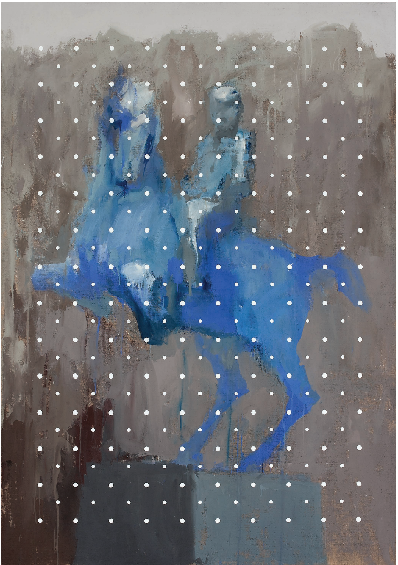
ედღვნება მხედრიონს და ყველა სამუდამო მხედარს, შერეული ტექნიკა, ტილო. 200 X 140

To "Mkhedrioni" and all eternal riders, Mixed Technique, Canvas. 200 X 140