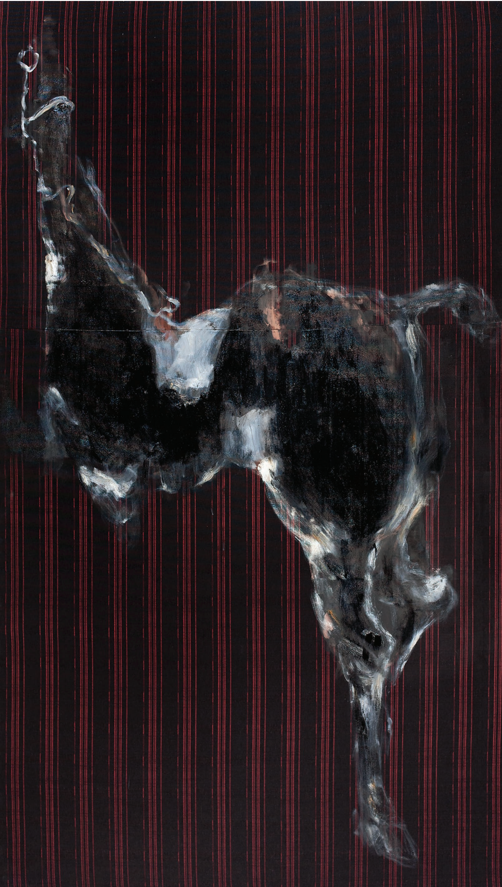
“გალუბკა”, შერეული ტექნიკა, ტილო. 230 X 130 “Golubka”, Mixed Technique, Canvas. 230 X 130