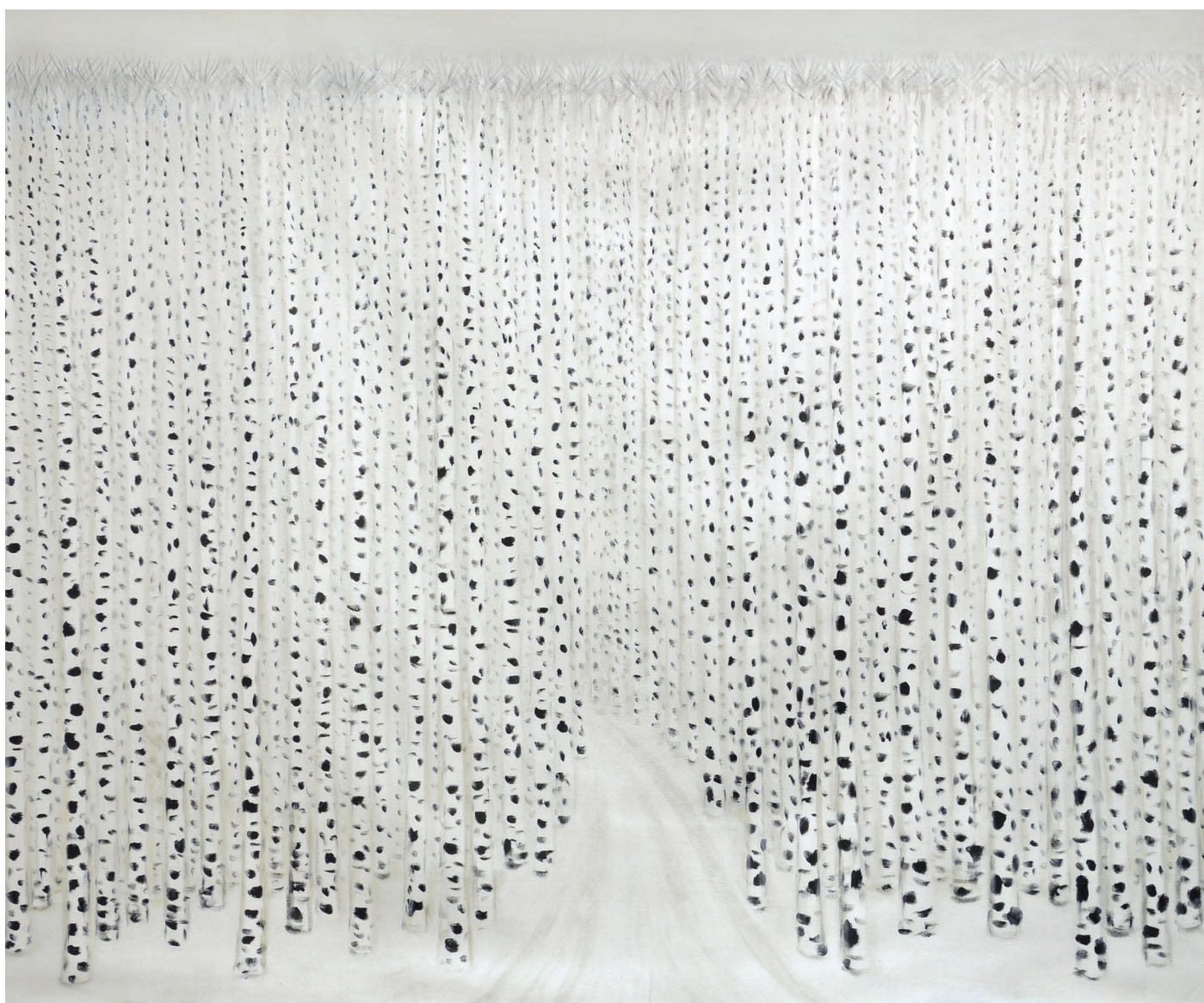
არყის ხეები, ტილო, აკრილი. 220 X 200 Birch Trees, Canvas Acrylic. 220 X 200