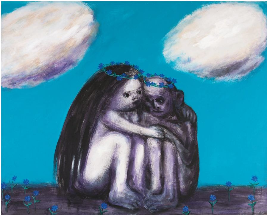
ღიღილოები მინდორში, ტილო, აკრილი. 200 X 150 Cornflowers in the Field, Canvas Acrylic. 200 X 150