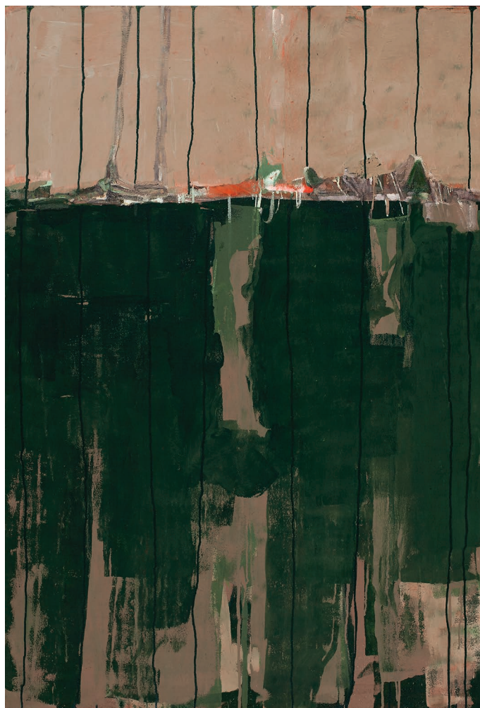
ნატურმორტი, შერეული ტექნიკა, ტილო. 150 X 200 Still Life, Mixed Technique, Canvas. 150 X 200