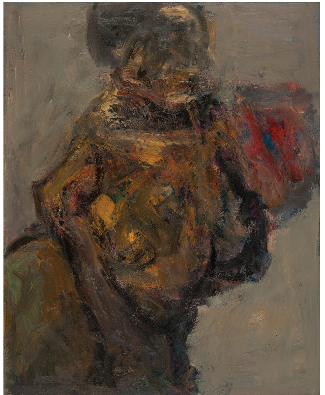
ტორსები, ტილო, ზეთი. 100 X 80 Torsos, Oil, Canvas. 100 X 80