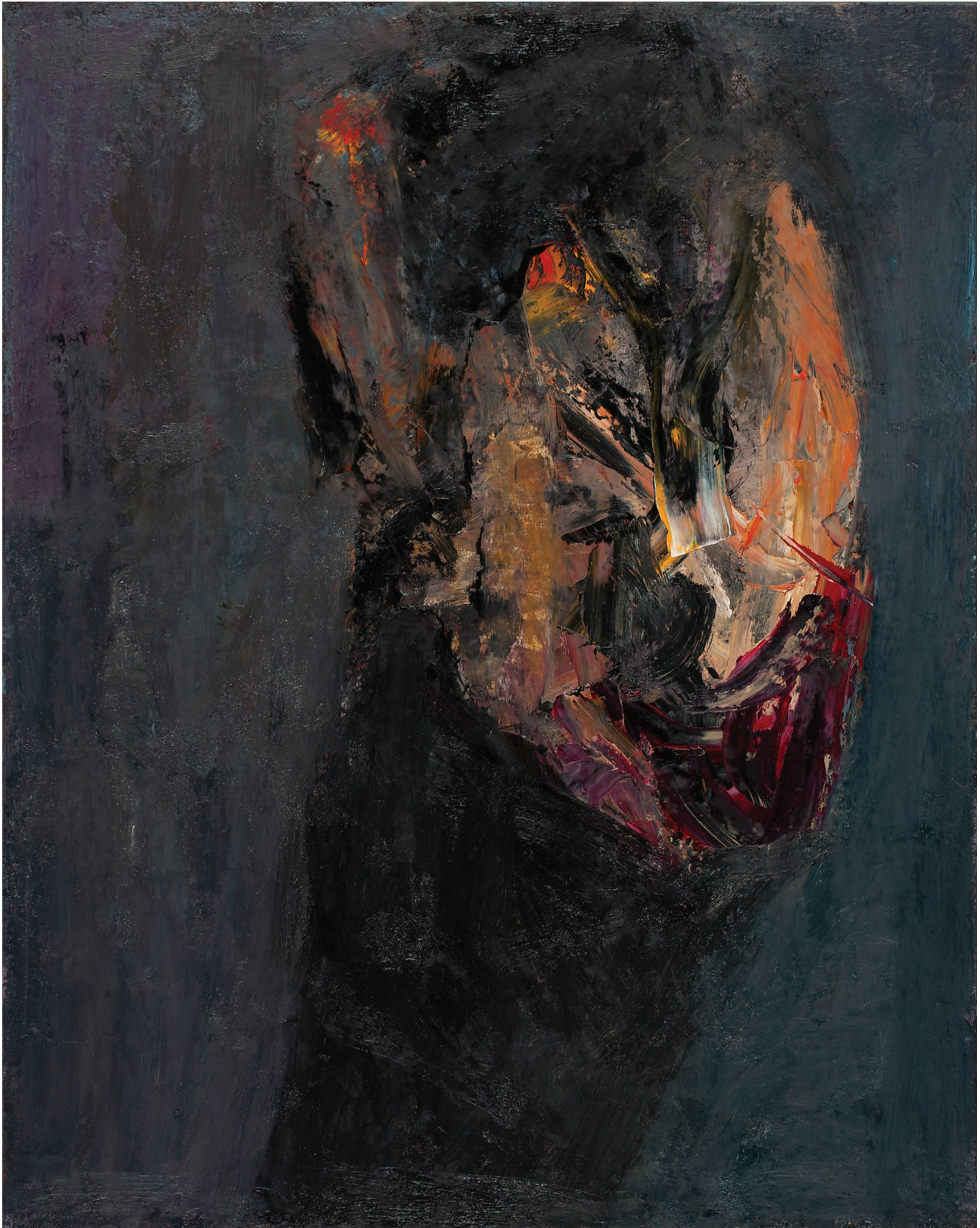
ტორსი, ტილო, ზეთი. 100 X 80 Torso, Oil, Canvas. 100 X 80