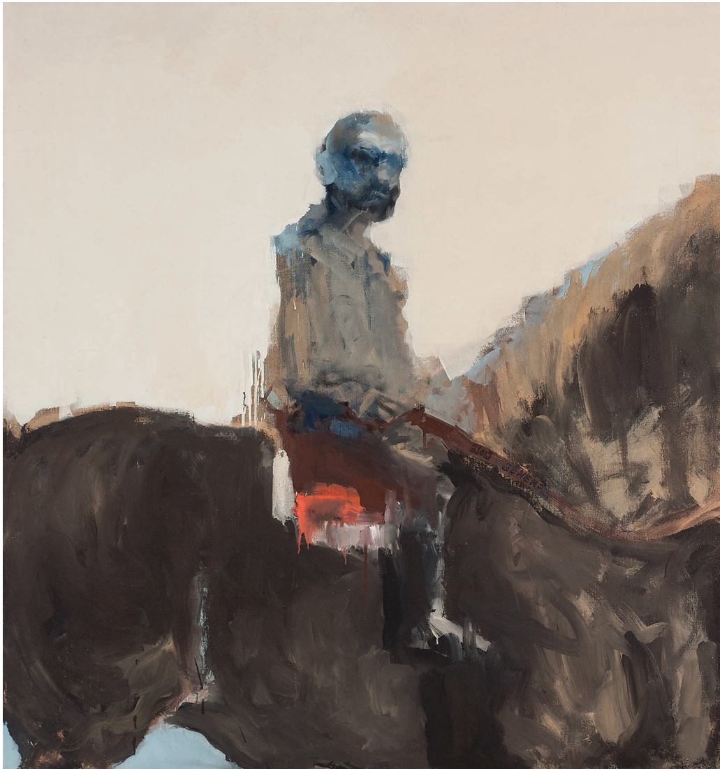
მათე გენერალა, შერეული ტექნიკა, ტილო. 150 X 140 Mate the General, Mixed Technique, Canvas. 150 X 140