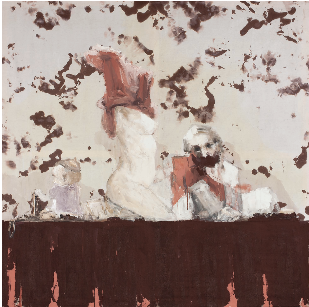
მეჯინების ოთახი, შერეული ტექნიკა, ტილო. 200 X 200 Stable-man's Room, Mixed Technique, Canvas. 200 X 200