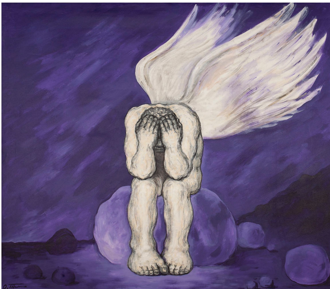
მგზუნვარე ანგელოზი, ტილო, აკრილი. 250 X 220 / Sad Angel, Canvas Acrylic. 250 X 220

- It is very important to know, whose works will be displayed next to yours and in what kind of space. I was lucky on both occasions: I show my works in the most academic space of Tbilisi and they will be presented next to the paintings of cool artists. I feel very well.