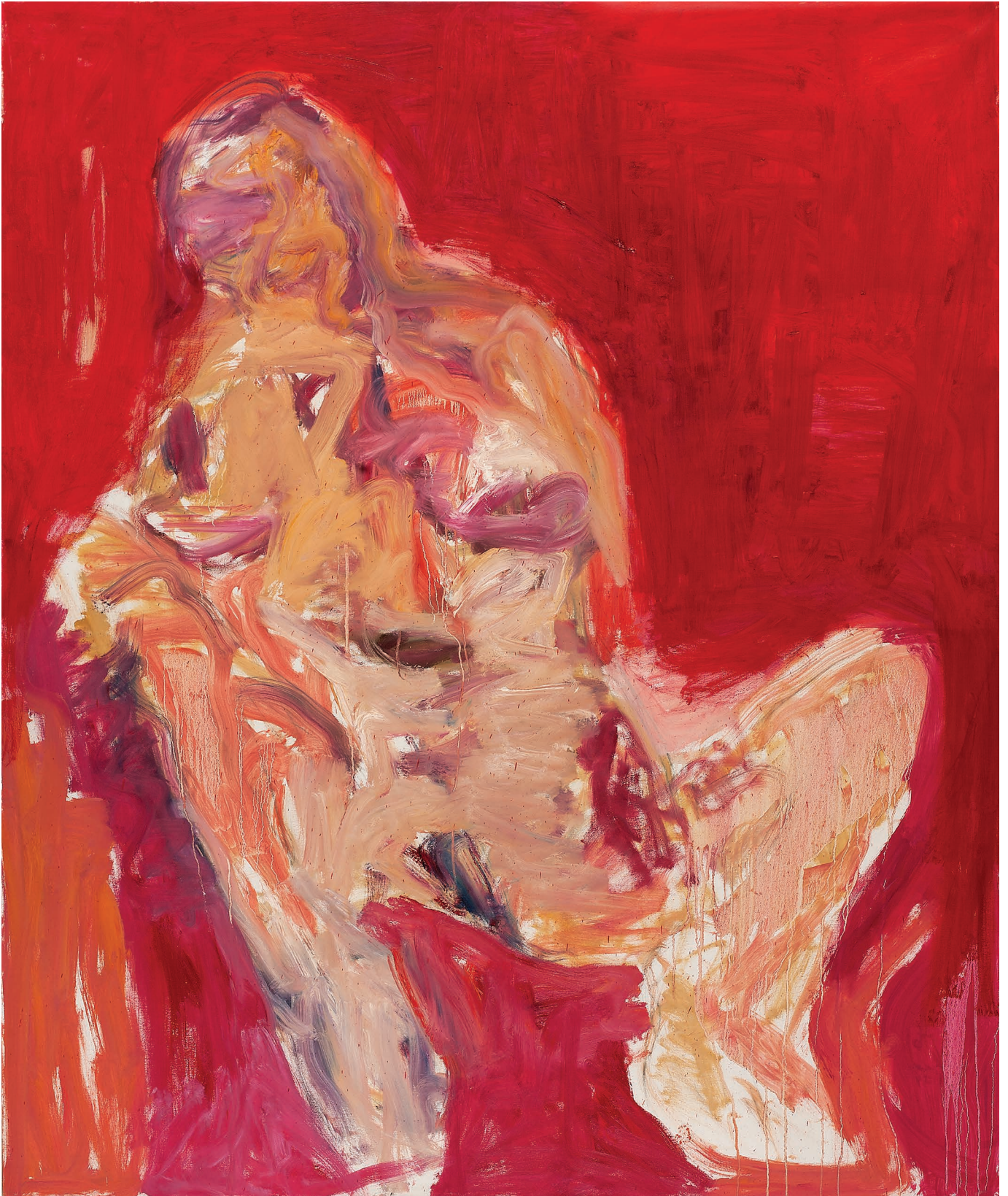
ტორსი, ტილო, ზეთი. 100 X 80 Torso, Oil, Canvas. 100 X 80